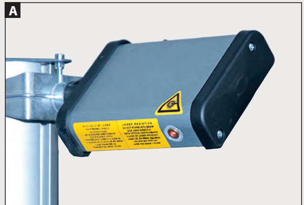
PUNTERO LÁSER para alineación longitudinal.