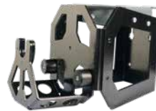
Satz Spannhalterträger für die Wandbefestigung mit Träger für zusätzliche Schnellspannhalter.