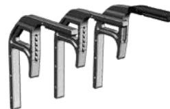
Satz Verlängerungen für das Verwenden an Lieferwagen.