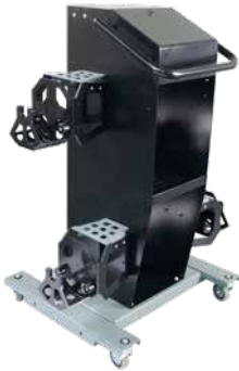
Mehrzweck-Trolley für Spannhalterträger und zusätzliche Schnellspannhalter.