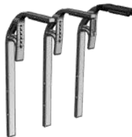
Satz Verlängerungen XL für Raddurchmesser von 32" bis 39".